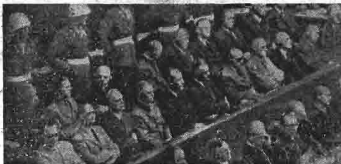
De nazi-oorlogsmisdadigers voor de rechtbank van Nürnberg.