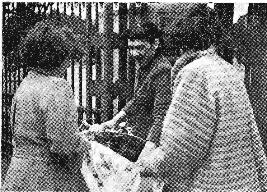
Op deze bladzijde twee beelden van de actie te Charleroi.

Het is begonnen bij de A.C.E.C. (Electriciteitsbouwbedrijven) van Charleroi. De vrienden van het Vredescomité der fabriek staken de koppen bijeen en overlegden hoe er te werk moest gegaan om de arbeiders in te lichten over wat ons met de E.V.G. boven het hoofd hangt, en hen toe te laten hun mening daarover te zeggen.