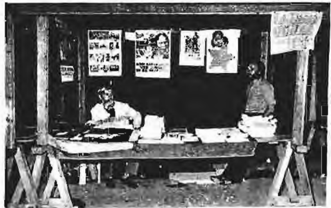
informatiestand op Kick 72 te Oostende.

Het Vietnam Comité Oostende en de Werkgroep Vrede en Rechtvaardigheid plaatsten in de jaarbeurs, tijdens een vier-tal dag, de BUVV tentoonstelling over Vietnam en hielden er een informatiestand open.