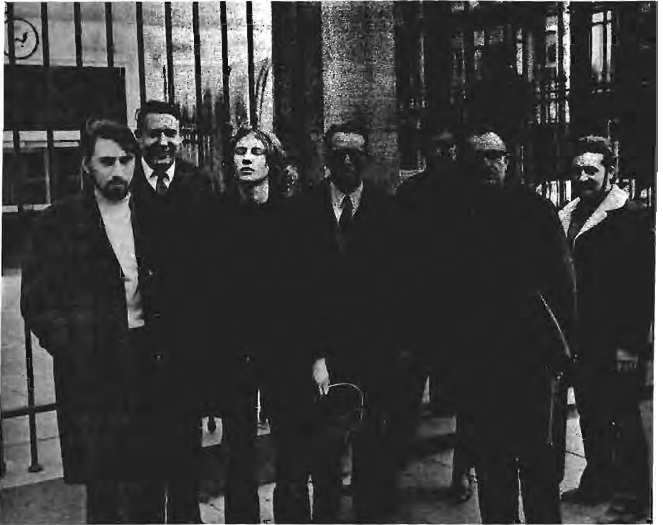
De delegatie van het Overlegcentrum voor de Vrede na het verlaten van de Ambassade van de Verenigde Staten. (Zie ons artikel).