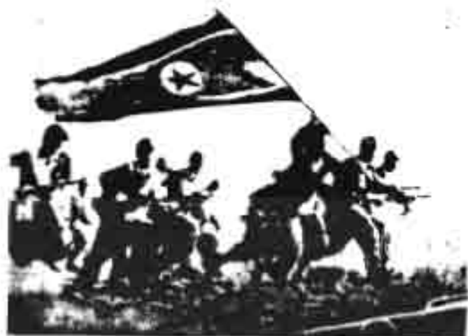
Overwinning van het Koreaanse volk op de Amerikaanse agressore