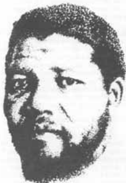
NELSON MANDELA 60 JAAR

Op 18 juli j.l. „vierde“ Nelson Mandela zijn zestigste verjaardag ; 34 jaar strijd, 16 jaar gevangenis op het gevreesde Robbeneiland. Nelson Rolihlala Mandela werd in 1918 geboren in Umtata, de hoofdstad van het z.g. thuisland Transkei als zoon van een „stamhoofd“.