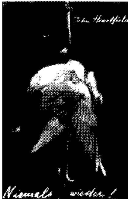
Poster te verkrijgen in Vrede

Rechts, links en de Eurokommunisten zijn voldaan. Het rijk van het kwaad, het kommunisme, is vernietigd. Ook de verdeelde Vredesbeweging kan terug ademen, de Russen komen niet en de Amerikanen mogen blijven.