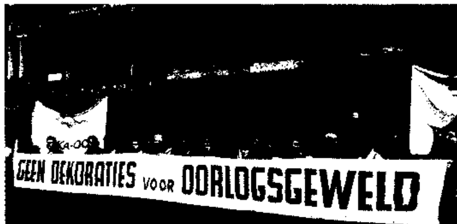
Protestdemonstratie van de vredesbeweging bij de decoratie van generaal Schwarzkopf door minister Eyskens op het stadhuis van Antwerpen.