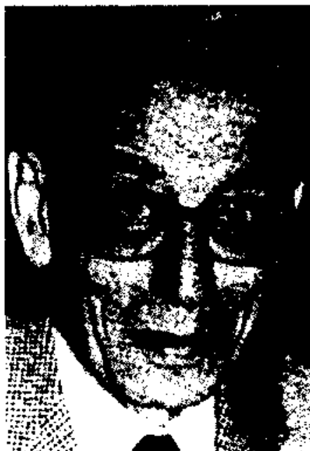
Wie is Boutros-Ghali

Gezien tot heden nooit een Afrikaan verkozen werd was het normaal dat deze maal iemand van dit kontinent aan de beurt moest komen. De Egyptische Boutros-Ghali haalde het uiteindelijk in de Veiligheidsraad, na verschillende stemronden, van de andere dertien kandidaten (ook niet-Afrikaanse) met 11 stemmen voor, en 4 onthoudingen van Bernard Cniarro, minister van Financiën van Zimbabwe die kon rekenen op 7 stemmen voor, 2 stemmen tegen en 6 onthoudingen.