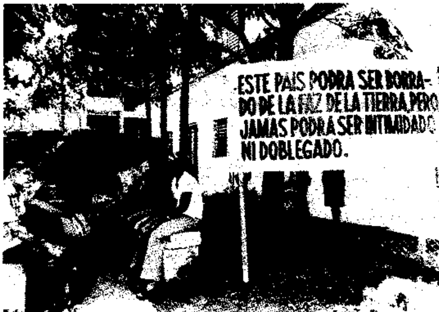
Dit land kan misschien van de kaart worden geveegd maar nooit zal het buigen.

Wisselstukken moeten nu uit Hongarije komen ... maar zijn te betalen in VS dollars.