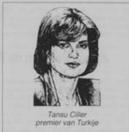
Tansu Çiller premier van Turkije

De schending van mensenrechten staat alleszins de economische samenwerking niet in de weg: in juli jl. verleende België aan Turkije een krediet van 5 miljoen dollar aan een lage intrestvoet (2 % over 15 jaar). De Belgische ambassadeur in Ankara, Eric Kobia, voegde daaraan toe dat "België de nodige steun zal verlenen om Turkije te integreren in de Europese Unie" (1).