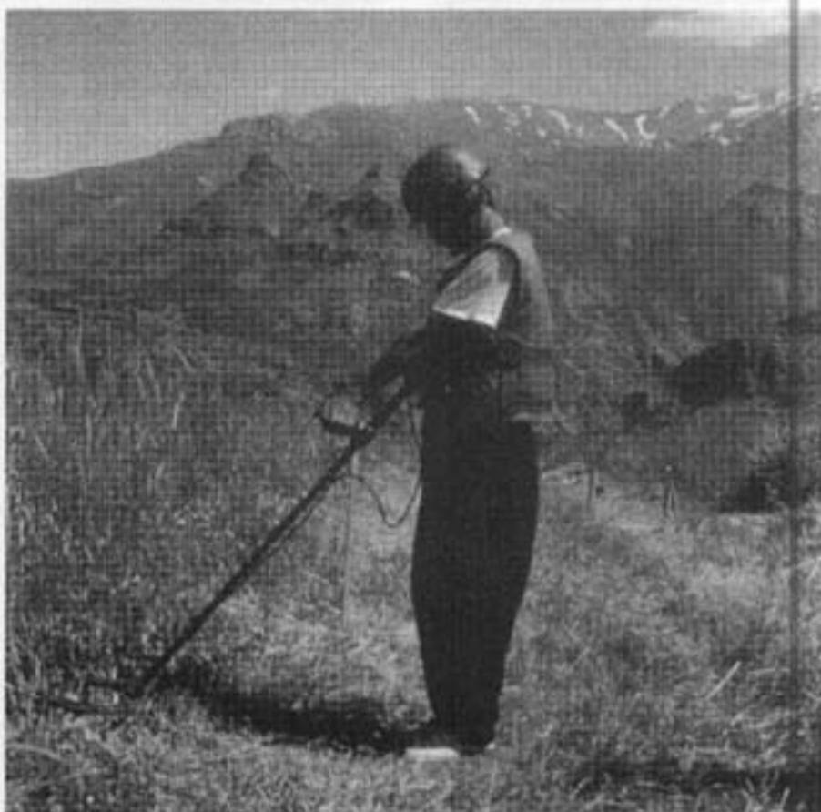
„Het wapen van de lafaard”

De verantwoordelijken voor het mislukken van de landmijnen-conferentie zijn in de eerste plaats China, India, Pakistan en Rusland. Het pleidooi van o.a. Groot-Brittannië en de Verenigde Staten om alle mijnen te voorzien van zelfvernietigende mechanismen kwam bij de eerstgenoemde groep landen over als een poging om de eigen technologische voorsprong in de nieuwe regels te verzilveren. Samen met een reeks andere discussiepunten leidde dit tot een impasse in de onderhandelingen. Enerzijds kan men betreuren dat de conferentie verder dan ooit verwijderd lijkt van