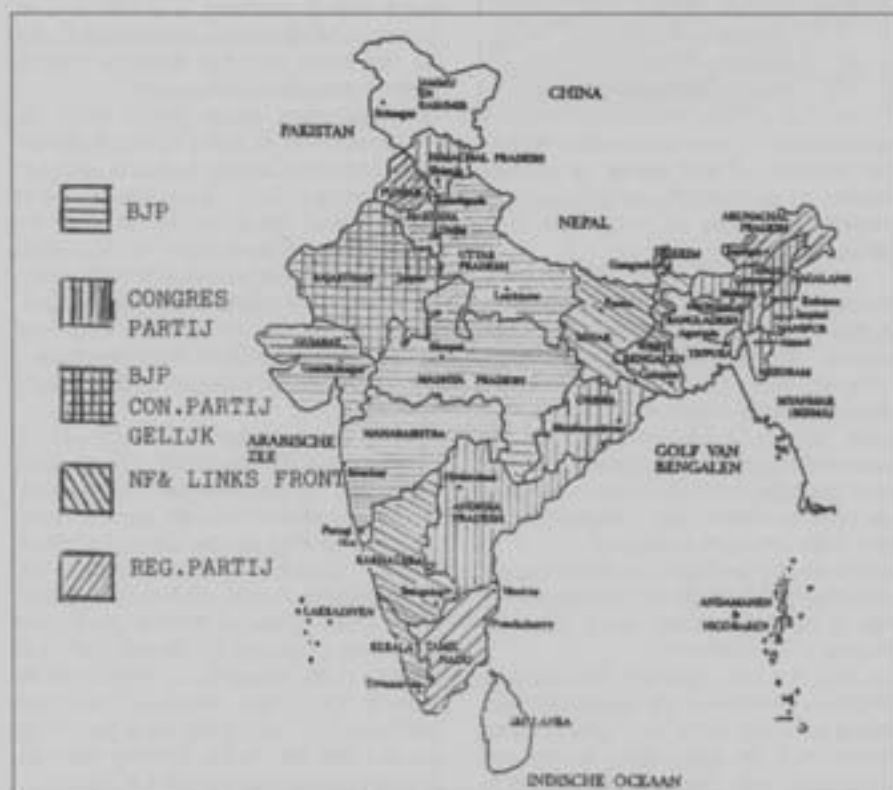
Verkiezingsbeeld per deelstaat

Belangrijkste uitvoermarkten: Europese Unie (28%), V.S. en Canada (18%), Zuid- en Zuidoost-Azië (16%), Oost-Europa en ex-Sovjetunie (12%).