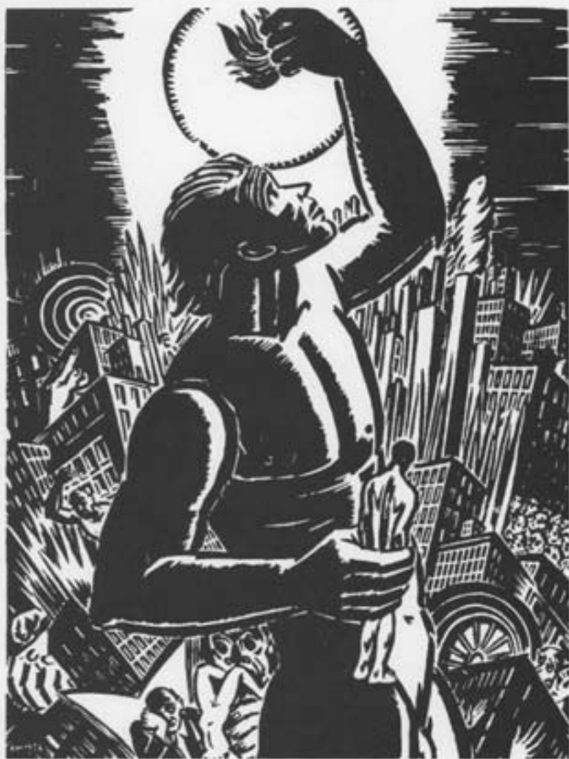
Prometheus, houtsnede, 1954