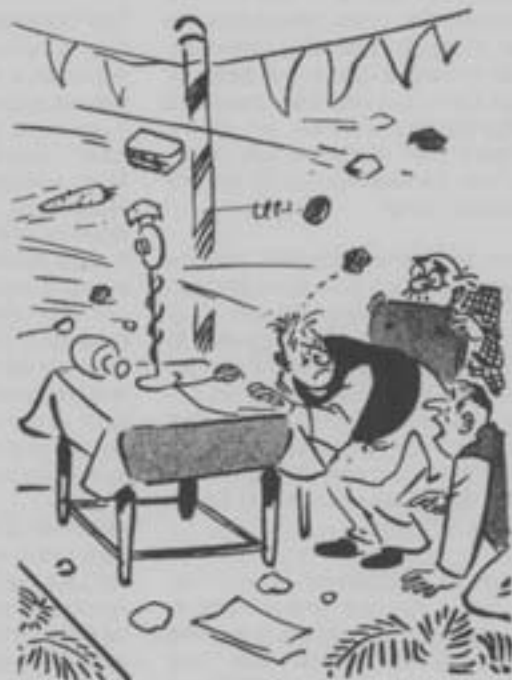
Nee, deze mensen zijn breeddenkend. Zij verafschuwen niet je Engelse, Hindi of Tamil-toespraak. Zij verafschuwen enkel je toespraak!

Zo hoopt men in het jaar 2000 de geboortes terug te dringen tot 10 per duizend. Bevallen in overheidsziekenhuizen is gratis. Voor de voorkoming van zwangerschap is de meest gebruikte methode de sterilisatie.