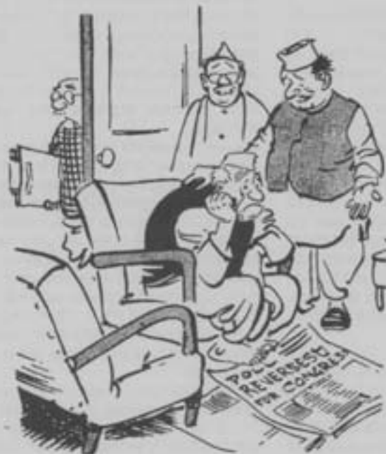
Neem deze nederlaag niet te ernstig. Zij wonnen slechts dankzij de steun van de bevolking, niets anders...

Maar de laatste tijd loopt deze stroom gastarbeiders terug. De laatste jaren is het aantal Keralezen dat in het Midden-Oosten aan de slag kan, gehalveerd. De economische groei is in deze staten voorbij. Keralese arbeiders zijn voor hen te duur. Migranten uit Pakistan, Bangladesh en de Filipijnen, Sri-Lanka en andere delen van India zijn bereid voor een veel lager loon te werken en zorgen dus voor de vervanging.