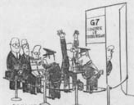
De G 7 tegen het terrorisme uit 'Le Monde'

In het World Competitiveness Report - Unctad 1995 - stelde men enkele andere vormen voor in het kader van de G 7.