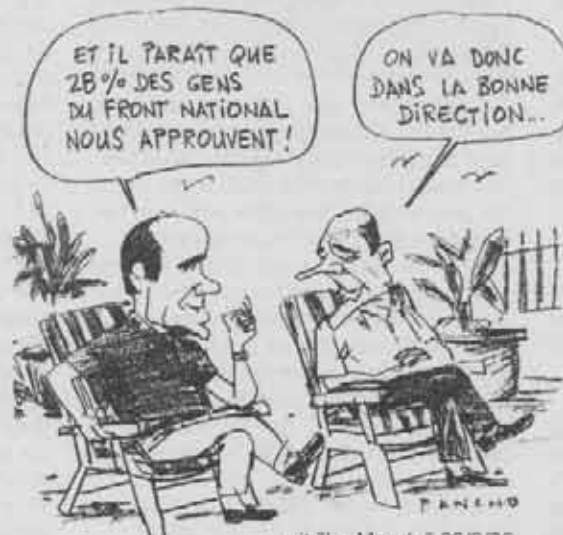
uit "Le Monde" 28/8/96 Juppé: "en het schijnt dat 28 % van de mensen van het Front National ons gelijk geven". Chirac: "we gaan dus in de goede richting".

Het aantal immigranten bedraagt in Frankrijk 7,4 % van de bevolking wat dezelfde verhouding uitmaakt sinds 1975.