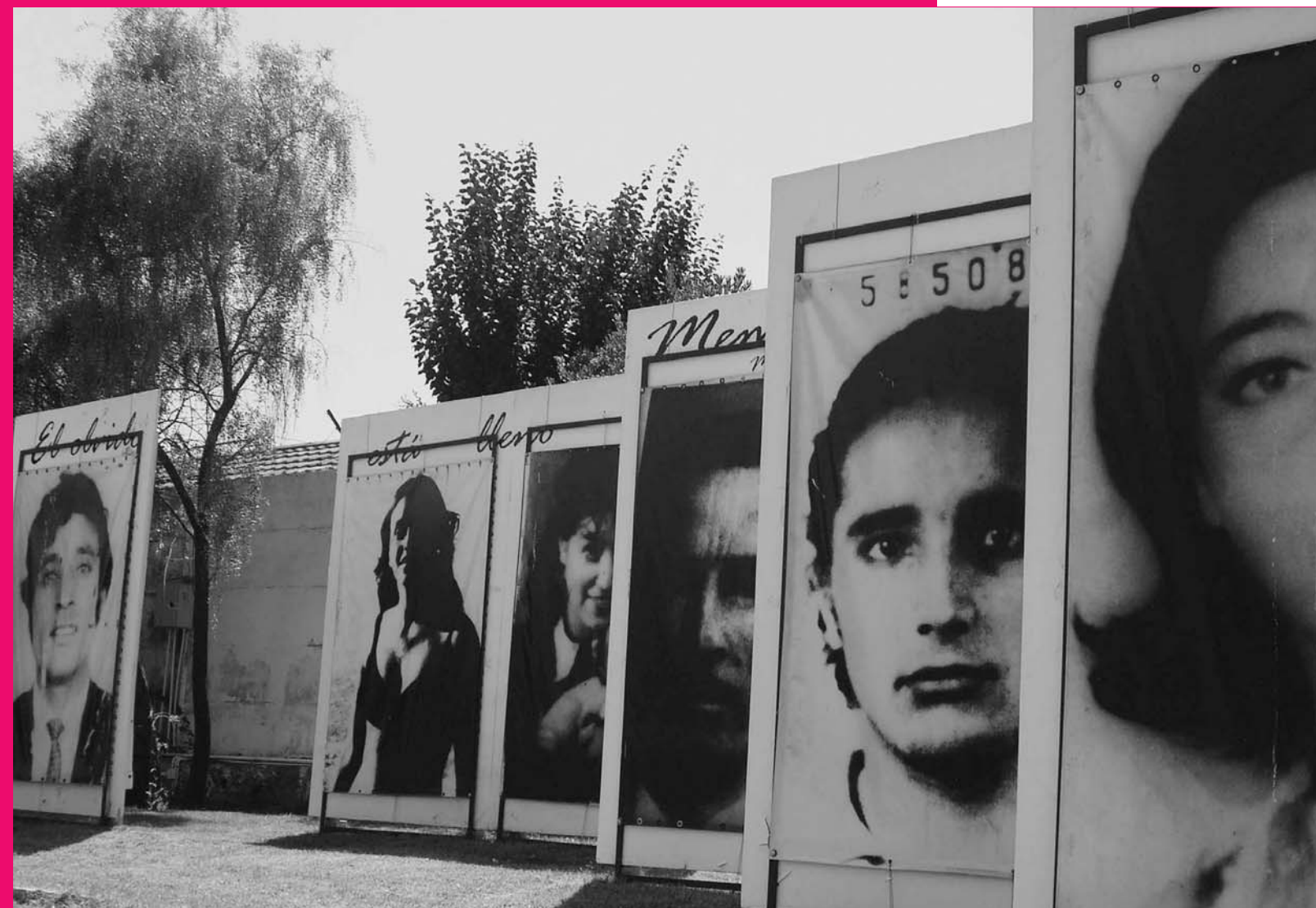
Herdenkingspark Villa Grimaldi, Santiago (Chili)