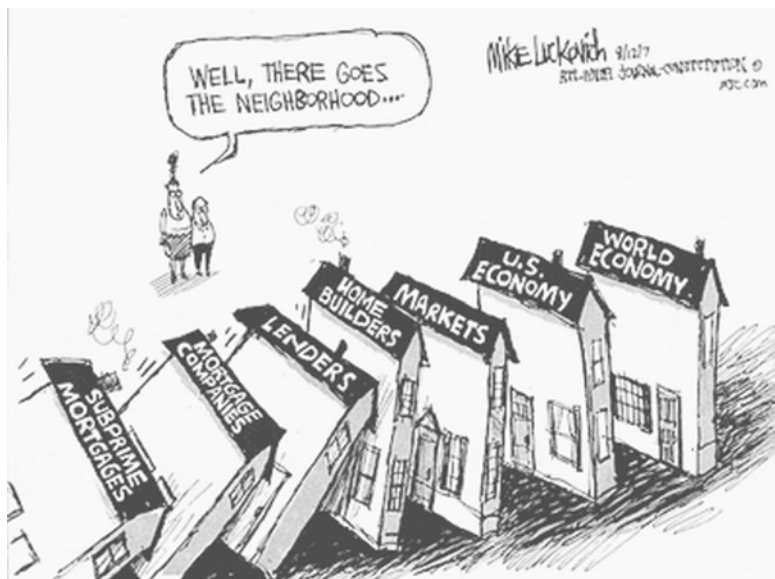
Daar gaat de buurt

zich vooral op het controleren van de inflatie (onder de 2% houden) terwijl de FED zich richt op een combinatie van stimuleren van economische groei en inflatiebestrijding. De reactie van de Amerikaanse centrale Bank (FED) op de huidige crisis die de Amerikaanse economie in recessie brengt is dus klassiek te noemen. De monetaire hefbomen worden bovengehaald: een serieuze renteverlaging wordt doorgevoerd. De rente werd ondertussen verlaagd tot 3%, een forse