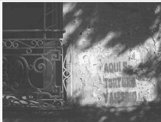
Martelhuis in Santiago

Tot nu toe is het de progressie van de mensenrechten(bewegingen) die de voornaamste democratisering van het post-Pinochet Chili markeert. Het was opnieuw de vastgeroeste politieke elite die in eerste instantie niet in staat bleek om zich uit de transitiepolitiek van compromis los te weken. In het onderhandelde pact van 1988 had Pinochet zichzelf en zijn kompanen namelijk van straffeloosheid verzekerd (ging terug op grondwet van 1980). Maar in het historische jaar 2001, werd zijn immuniteit uiteindelijk verworpen dankzij de inspanningen van de mensenrechtenbewegingen en hun advocaten. De eerste Chileense rechter die Pinochet veroordeelde, Juan Guzman, kon voor een lange tijd nergens gaan eten zonder dat het volledige restaurant hem trakteerde op een staande ovatie. Pinochet verloor alle zaken aangespannen tegen hem vanaf 1998, maar hij slaagde er toch in ongemoeid te blijven door zich ziek of gek te laten verklaren. Honderden van Pinochets medestanders en generaals zijn ondertussen wel berecht en veroordeeld. Tientallen onder hen zitten sinds 2006